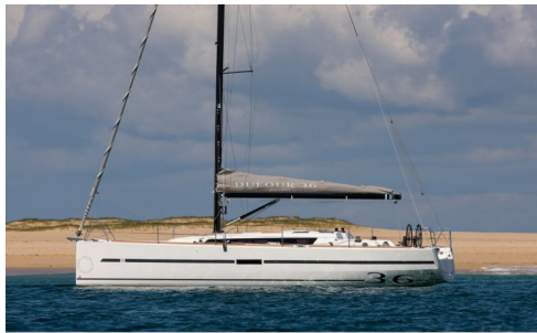
DUFOUR 36