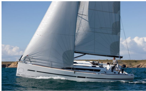
DUFOUR 36