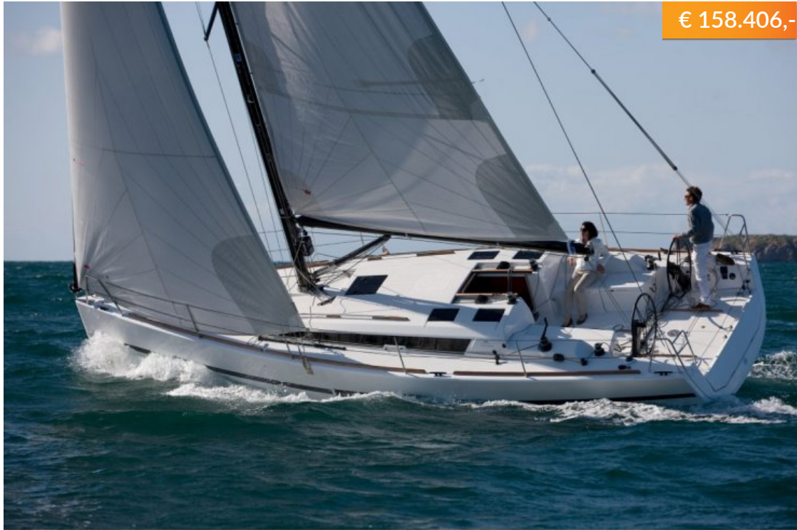
DUFOUR 36