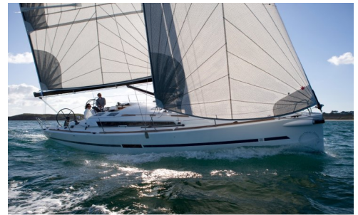
DUFOUR 36

Merk: Dufour Prijs: € 158.406,- Lengte: 10.99 m Breedte: 3.61 m Romp materiaal: Polyester Bouwjaar: